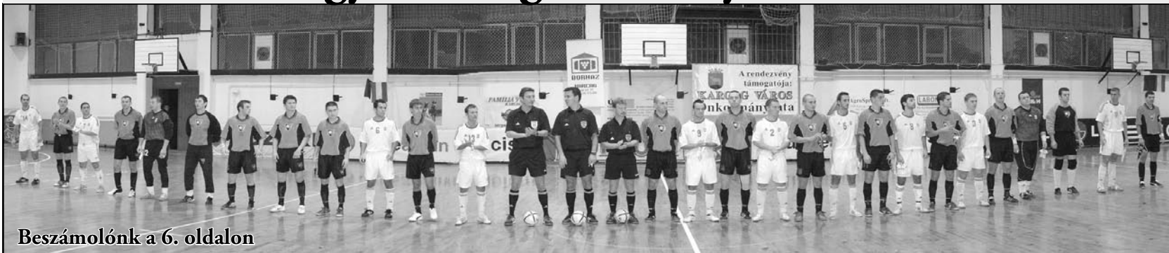
Beszámoló a 6. oldalon