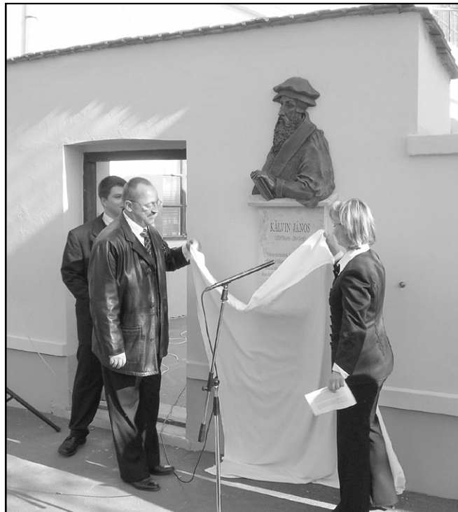
Képes beszámoló a 4. oldalon