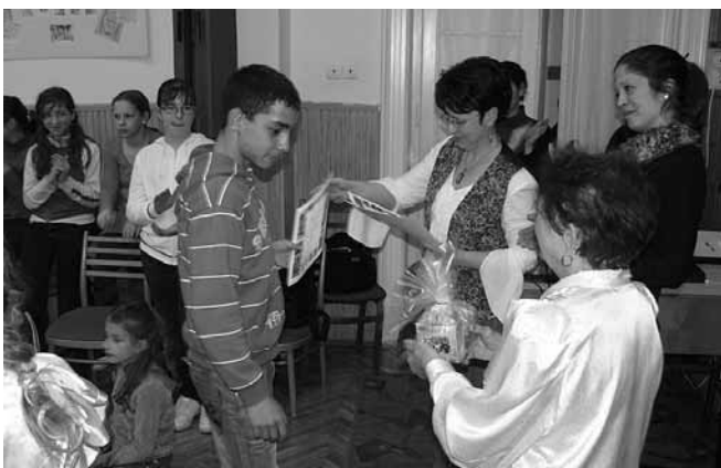
Nagy siker volt április 1-jén az Erkel Ferenc Alapfokú Művészetoktatási Intézmény diákönkormányzati napja, amikor vétékdedő, népdal karaoke és tánc ház színesítették a délutánt.