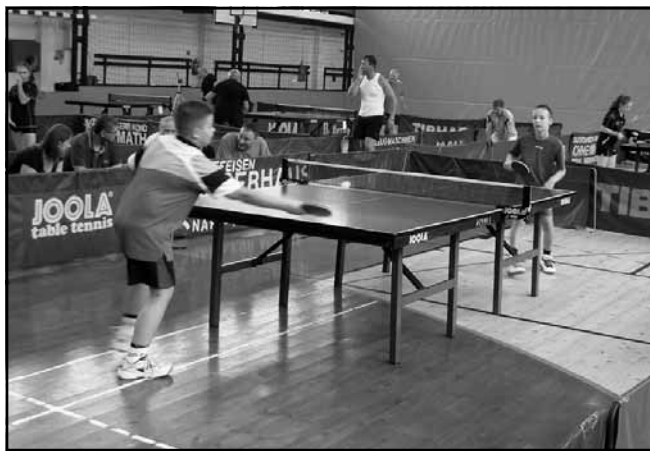
Fotónk az Alkotmány Kupán készült

A Kováts DSE asztalitenisz szakosztálya által augusztus 20-ára, a Sportcsarnokba meghirdetett rangos asztalitenisz verseny iránt most sem maradt el az érdeklődés, és mivel a Kelet-Magyarországot elérő intenzív esők több csapat utazását is hátráltatták, a rendezvény néhány órára „csúszással” kezdődött. Végül negyvenhárom nevezés érkezett, és tizenegy település ill. sportgye-