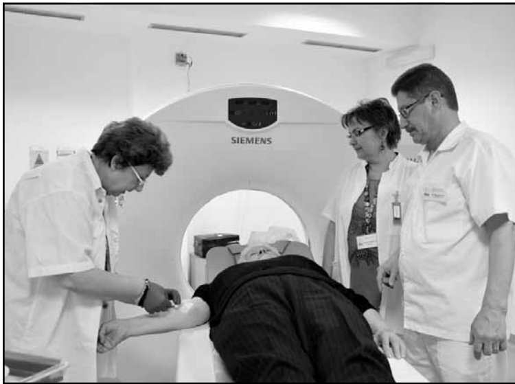
Évente több ezer CT vizsgálatot végeznek a karcagi kórházban

Az osztályon hárman vagyunk orvosok, két fiatalabb kollégámmal végezzük a munkát. Éves szinten CT vizsgá-