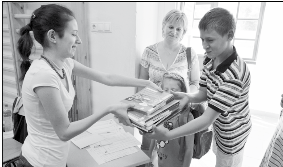
A gyerekek nagy örömmel vették át tankönyveiket. Képünk a Karcagi Nagykun Református Általános Iskolában készült

A 2015/16-os iskolai tanévet városunk valamennyi tanintézményében valamivel több mint 3000 tanuló kezdte meg. A nyár folyamán mindenhol elkészültek azok