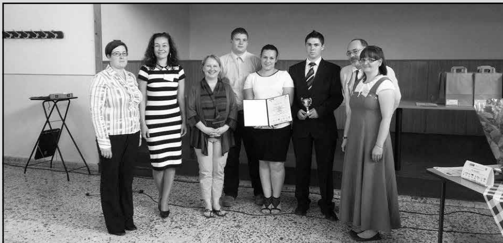
A zsűri tagjaival