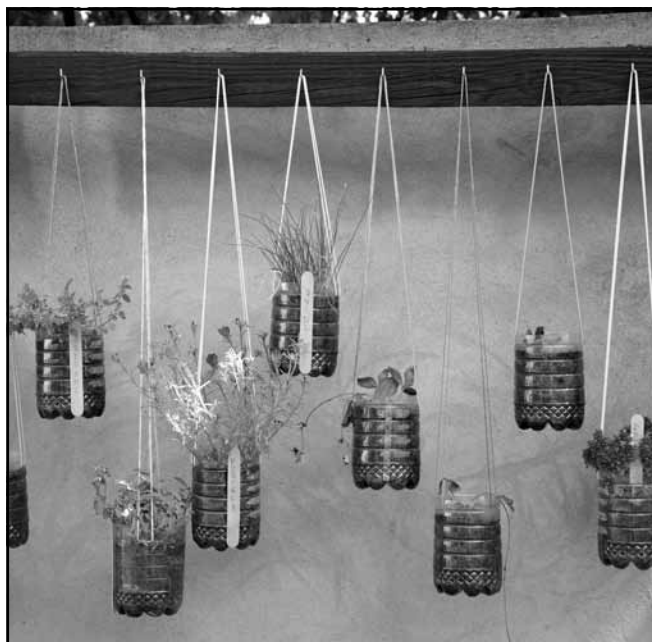
A Szociális Szolgáltató Központban ötletes petpalackkertet készítettek

„A legszebb konyhakertek” – Magyarország legszebb konyha-