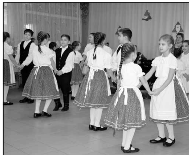
A rendezvényen műsort adott a Déryné Árendás néptáncosportja