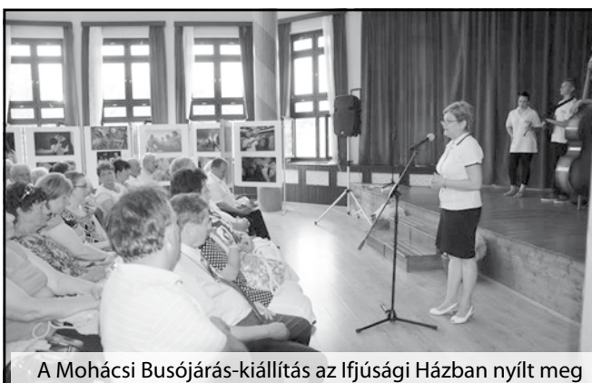
A Mohácsi Busójárás-kiállítás az Ifjúsági Házban nyílt meg