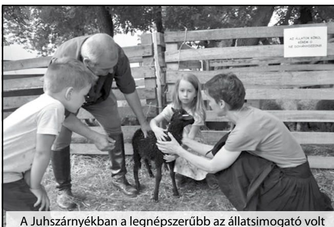
A Juhszárnyékban a legnépszerűbb az állatsimogató volt