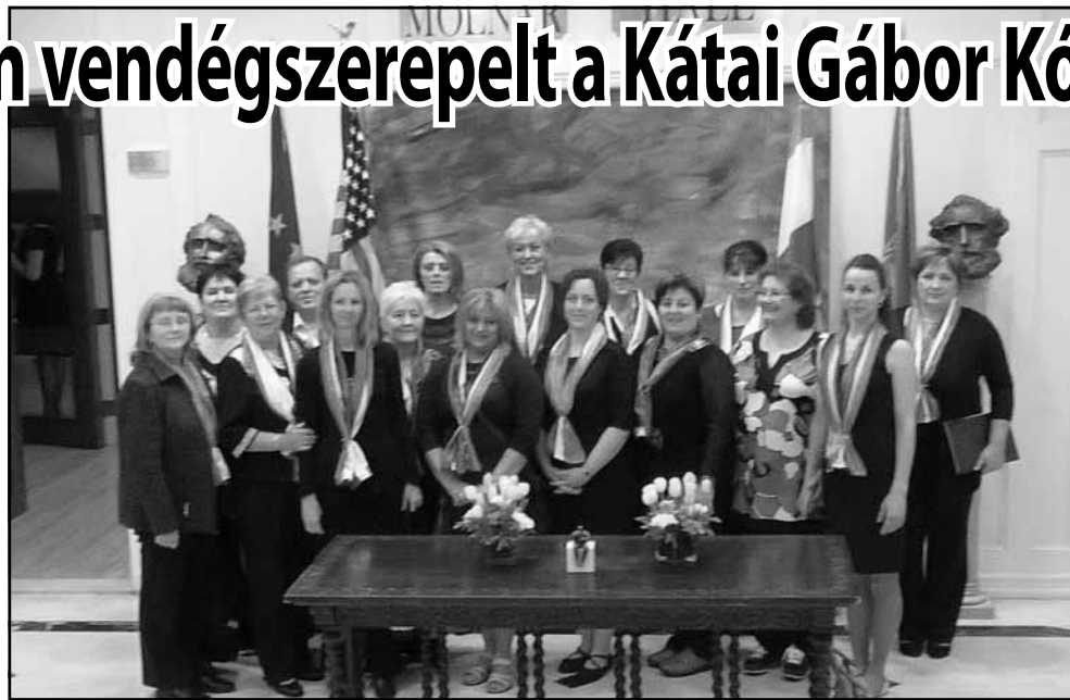
A kórusnak nagy álma teljesült az amerikai úttal

A kórus krónikása, egyik alapítója Budai Antalné : - A kórus