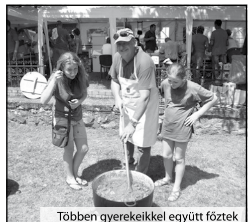
Többen gyerekeikkel együtt főztek