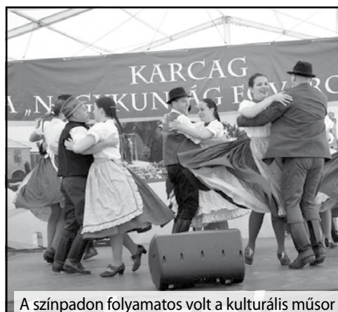
A színpadon folyamatos volt a kulturális műsor