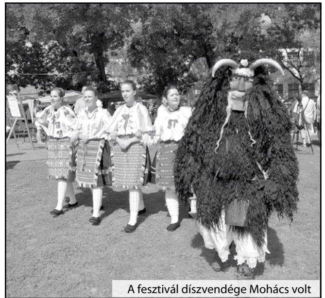
A fesztivál díszvendége Mohács volt

A fesztivál idején is bebizonyította, hogy a hungarikum karcagi birkapörköltért akár több száz kilométert is utaznak a látogatók, hogy megkóstolhassák ünnepi ételünket és jó híret vigyék Karcagnak, a Nagykun-ság fővárosának.