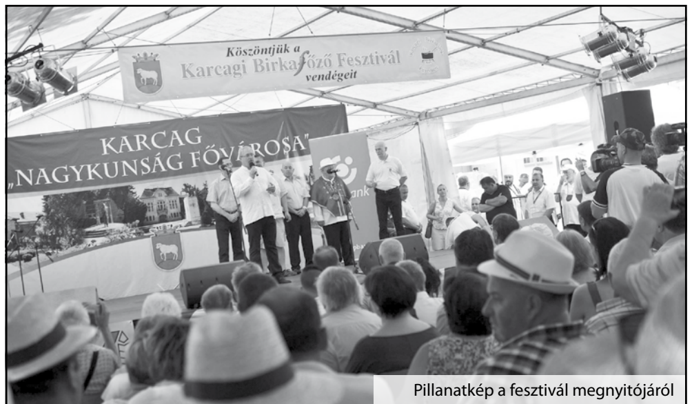
Pillanatkép a fesztivál megnyitójáról