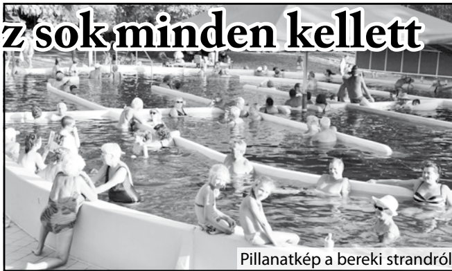
Pillanatkép a bereki strandról

- Köszönöm mindenkinek a rengeteg szavazatot, az elért eredményre a jövőben is igyekszünk részlegesen. Megmondom őszintén, arra számítottam, hogy az első tizenben benne leszünk a vendégektől kapott nagyon sok pozitív visszajelzés alapján. A sikerhez azonban sok minden kellett, az egyik legfontosabb a tisztaság, amire folyamatosan odafigyelünk. Utána az, hogy nagy zöld, több hektáros fás területünk