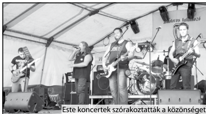
Este koncertek szórakoztatták a közönséget

gyon elégedett. Jubileumi beszédben elmondta, hogy a program sikere nemcsak az ő érdemük. Nagyon nagy köszönettel tartoznak a város vezetésének, és a für-