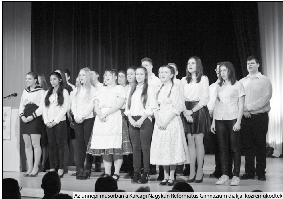
Az ünnepi műsorban a Karcagi Nagykun Református Gimnázium diákjai közreműködtek