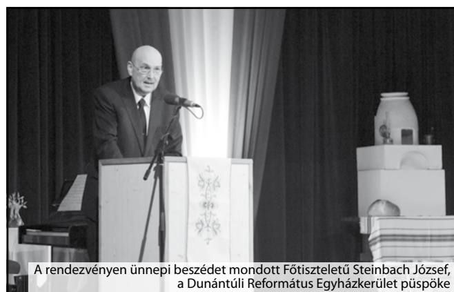
A rendezvényen ünnepi beszédet mondott Főtisztelendő Steinbach József, a Dunántúli Református Egyházkerület püspöke

amíg a közvetlen környezetünket, hagyományainkat, hitünket, felfedezéseinket, alkotásainkat, kultúránk szépségeit, kincseinket nem ismerjük igazán – hangsúlyozta a püspök, aki azt is kiemelte, hogy a kultúránk egyik legfontosabb hordozója a szeretett anyanyelvünk. - Adjuk ezeket a kincseket tovább a következő generációnak. Figyelve a jelen felgyorsult, ellentmondásos, nehezen értelmezhető világában is az értékekre felelős szűrővel, türelmes szeretettel, és mégis Isten