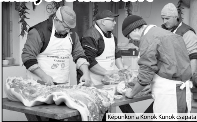
Képünkön a Konok Kunok csapata

- A gyerekeim is nagyon élvezik, nem munkának fogják fel, hanem családi, baráti eseménynek. Gyerekkoromban mindig küldtük és kaptuk a kóstolót, tudtuk kinek finom a hurkája, a kolbásza, kinek gyengébb a toros káposztája, s azt is, kinek van jó hentese. Mint minden gyermek, szívesen kóstoltam az abalében megfőtt malacfület, a májat, a fejhúst, de a toros káposzta, az orjaleves, a májas hurka, a hagymás vér, a