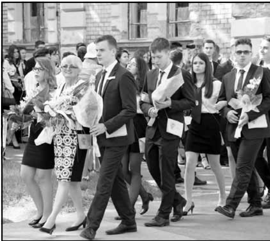
Karcagi SZC Varró István Szakgimnáziuma, Szakközépiskolája és Kollégiuma