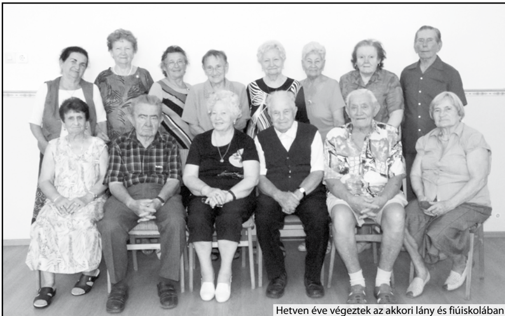
Hetven éve végeztek az akkori lány és fiúiskolában