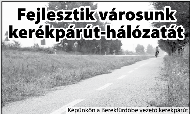
Képünkön a Berekfürdőbe vezető kerékpárút