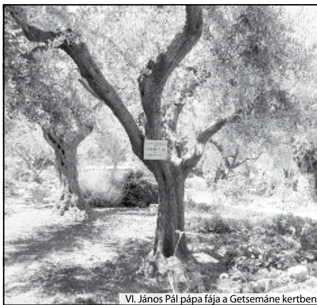
VI. János Pál pápa fája a Getsemáne kertben

Az 1920-ban összeült arab kongresszus létrehozta a Palesztin Arab Végrehajtótanácsot, amely ettől fogva a zsidó bevándorlás és földvásárlások ellen küzdött.