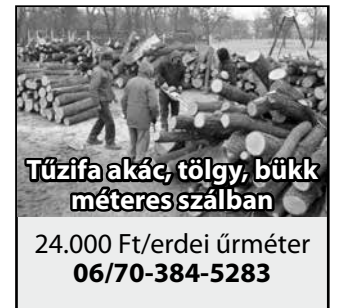
Tűzifa akác, tölgy, bükk méteres szálban

Az Orgonda Agrár Kft. földet bérelne, és vállal növényvédelmi szaktanácsadást. Tel.: 06/30-785-0690.